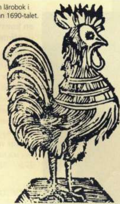
Bild från en lärobok i svenska från 1690-talet.

På 1690-talet bestämdes det att klockaren eller prästen i varje församling skulle undervisa barnen med hjälp av svenska böcker.