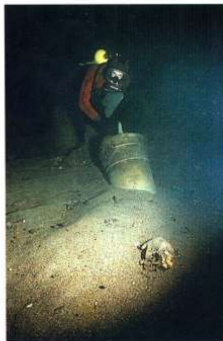
Dykaren har funnit en bronskanon och ett kranium på den plats där vraket av regalskeppet Kronan ligger.

Det var en fruktansvärd tid för folket i Skåne, både för invånarna i städerna och på landsbygden. Danska och svenska knektar misshandlade och plundrade vanligt folk. Bönder och borgare blev snabbt trötta på kriget. De ville ha fred. Sedan gjorde det detsamma vem som segrade.